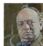
أوائل القرن العشرين وينستون تشرشل من قبل والتر سيكرت 1927