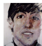
أواخر القرن العشرين بول مكارتني (الأخوة مايك) من قبل سام والش 1964