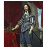
القرن السابع عشر الملك تشارلز الأول من قبل دانييل مايبتيس 1631