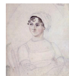
أواخر القرن الثامن عشر وأوائل القرن التاسع عشر جين أوستن من قبل كاسندرا أوستن حوالي 1810