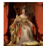
العصر الفيكتوري الملكة فيكتوريا صورة طبق الأصل بواسطة السير جورج هايتز 1838/1863