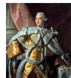
القرن الثامن عشر الملك جورج الثالث ستوديو آلان رامزاي 1762-1761